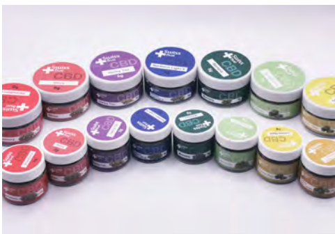
Packaging des Fleurs de CBD en 2 et 5gr

Nos produits de haute qualité vous aideront à vous démarrer sur le long-terme par rapport à vos concurrents qui commercialisent déjà du CBD . Démarrer le CBD c'est se donner la chance d'augmenter son chiffre d'affaires sans prendre de risque sur le marché le plus porteur des 10 prochaines années. d'augmenter votre chiffre d'affaires .